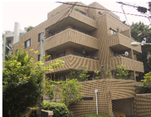
図面と現況が相違する場合は現況を優先します